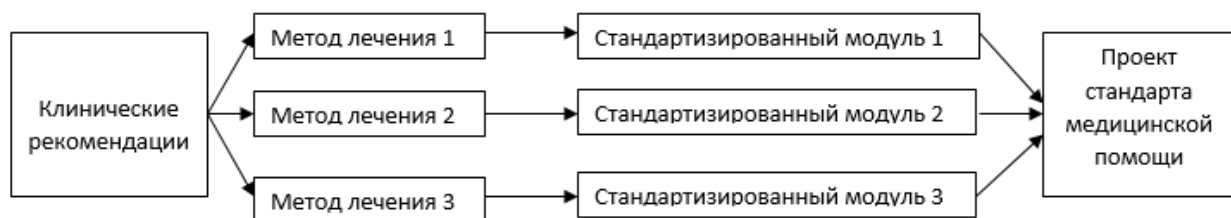
Рисунок 2 – Принцип формирования проекта стандарта медицинской помощи

5.1 Проект стандарта медицинской помощи формируется на основе клинических рекомендаций по соответствующему заболеванию или состоянию (группе заболеваний или состояний) из стандартизированных модулей, включающих этап диагностики (в случае его выделения при анализе клинических рекомендаций) и методы лечения (принцип формирования проекта стандарта медицинской помощи представлен на рисунке 2). При этом каждому методу лечения соответствует стандартизированный модуль. Проект стандарта медицинской помощи включает в себя медицинские услуги, лекарственные препараты, компоненты крови, медицинские изделия, имплантируемые в организм человека, виды лечебного питания, включая специализированные продукты лечебного питания, включенные в стандартизированные модули, разработанные на основе клинических рекомендаций, с учетом специальных меток (комментариев).